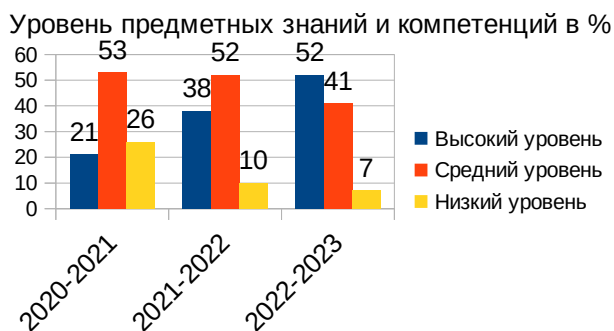
Диаграмма 1. Динамика качества освоения ДООП "Юные краеведы Оренбуржья"