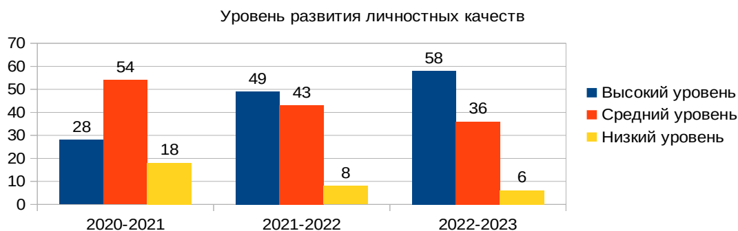
Диаграмма 3. Динамика развития личностных результатов